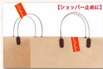
【ショッパー止めに】