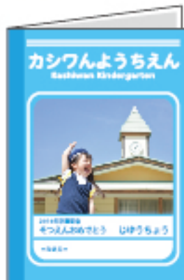
写真を入れて学習帳風に!